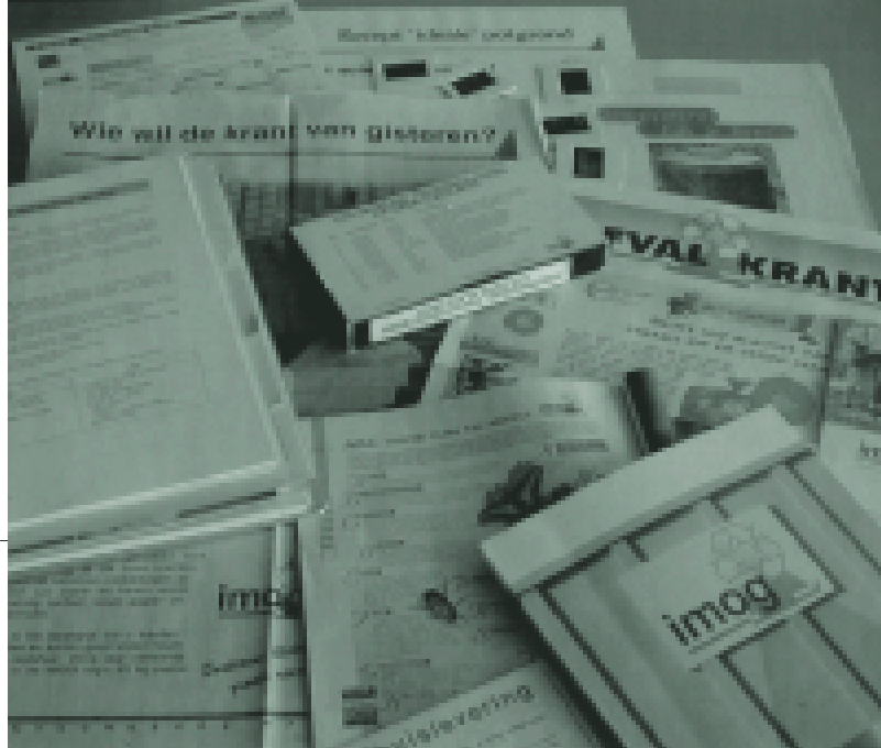
Continue communicatie met de burger