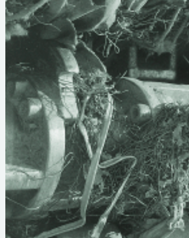
Sorteercentrum verkleining grof afval

bewust te maken van de noodzaak van afvalpreventie.”